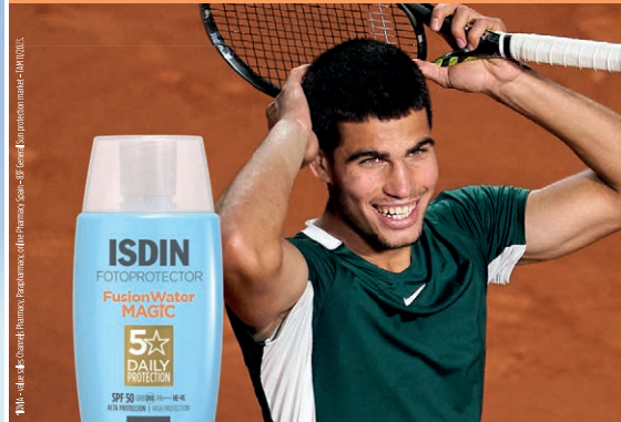
Carlos Alcaraz #1 Wimbledon Champion 2023